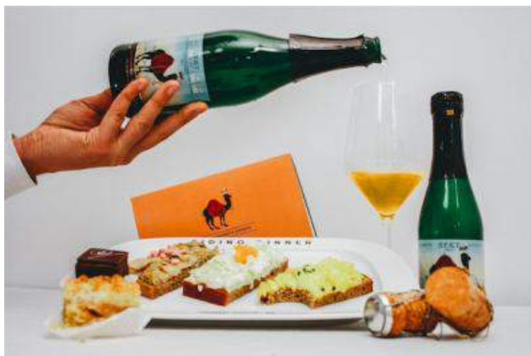
Abbildung: Wiener Genussbox – Riding Dinner

Bitte beachten Sie, dass das Paket nur ab einer Mindestteilnehmerzahl von 9-12 Personen bzw. 3 Kutschen bis maximal 88 Personen bzw. 22 Kutschen zeitgleich gebucht werden können.