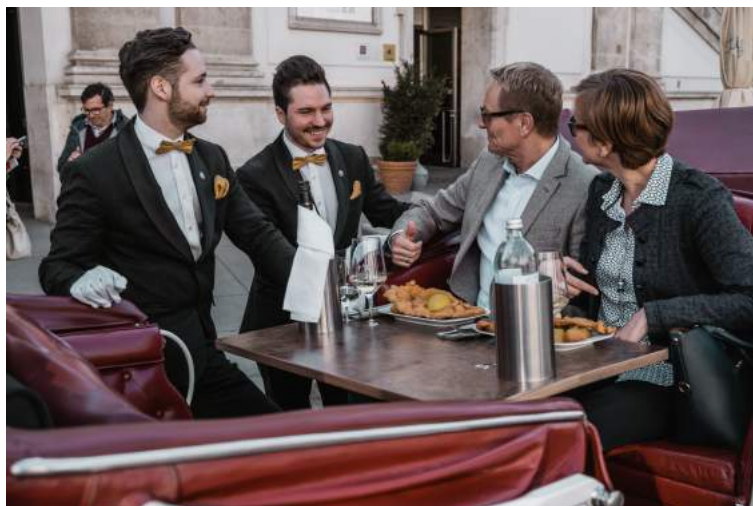
Abbildung: Wir vereinen Genuss & Erlebnis für alle Sinne.

Telefon: + 43 676 66 04 980 Email: r.novotny@ridingdinner.com