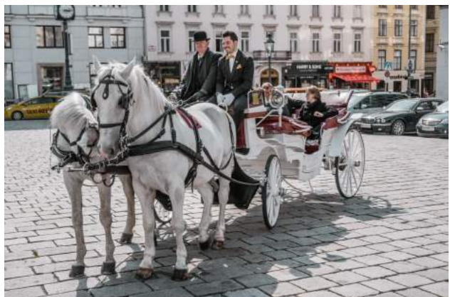
Abbildung: komfortabel getrunken & gespeist wird während der Fahrt in unserem rollenden Restaurant.