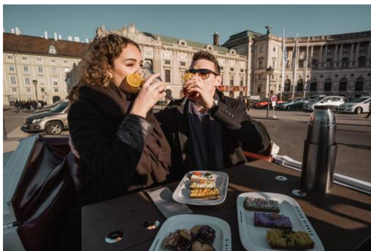
Abbildung: Tea Time & Coffee Break